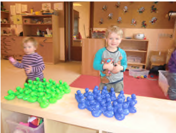
Sortieren nach Farben