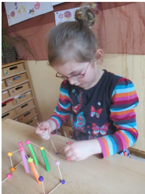
Frustrationstoleranz & Figur- Raumwahrnehmung