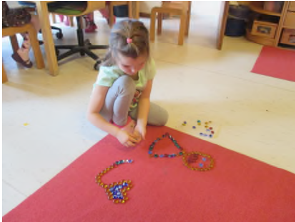
Zählen & Sortieren