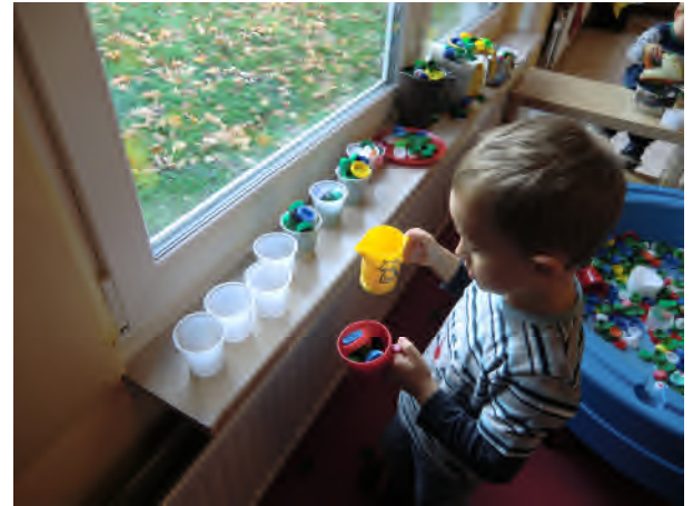
Mengen vereinzeln/ teilen