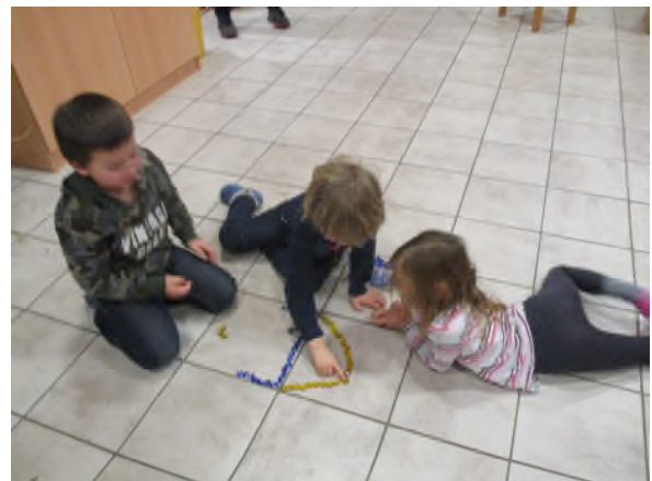
.... Mal gemeinsam