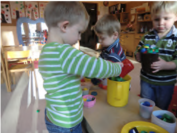
Wahrnehmung von Mengen