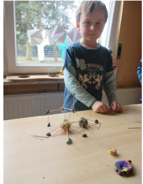
Freude am Tun