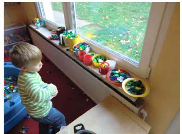
...und vieles mehr