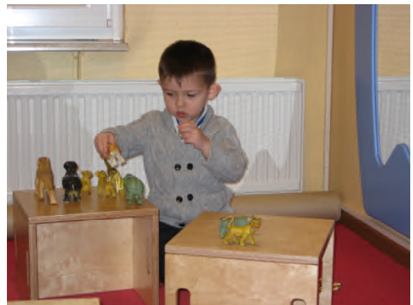
Große Mengen/ kleine Mengen