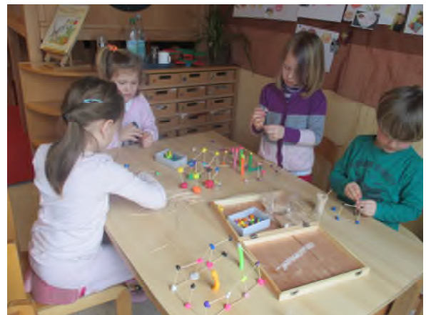
Einzel- und Teamarbeit